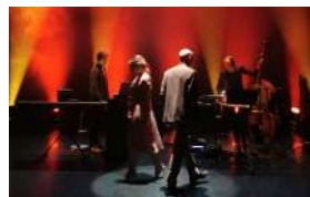
LE (PRESQUE) BAL