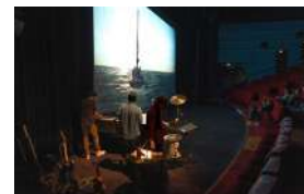
MACHINES À RÊVES