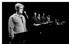
ZÀI ZÀI ZÀI ZÀI