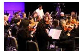
CONCERT DU NOUVEL AN