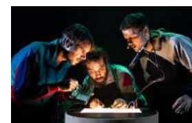
SECRETS DE BEATMAKER