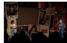
FAUT-IL SÉPARER L'HOMME [...]