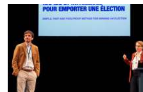
L'ART D'AVOIR TOUJOURS [...]