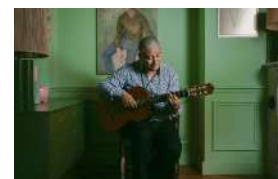
CESÁRIA ÉVORA ORCHESTRA