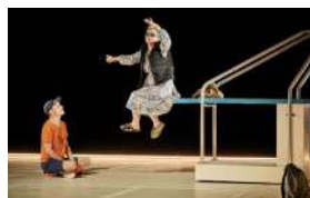
ALLEZ, OLLIE... À L'EAU !